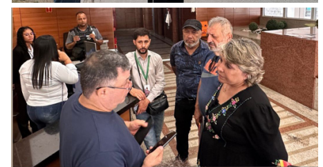
Comissão recebida na AGU