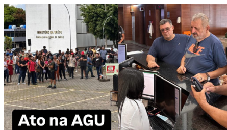
Ato na AGU

Os técnicos mantêm a greve e a deputada reafirmou o compromisso com a luta da categoria na busca de todos os caminhos para garantir os 26,05% integral para todos.