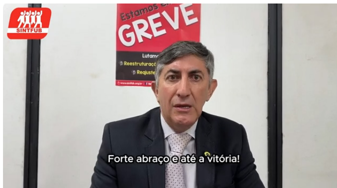
Forte abraço até a vitória!